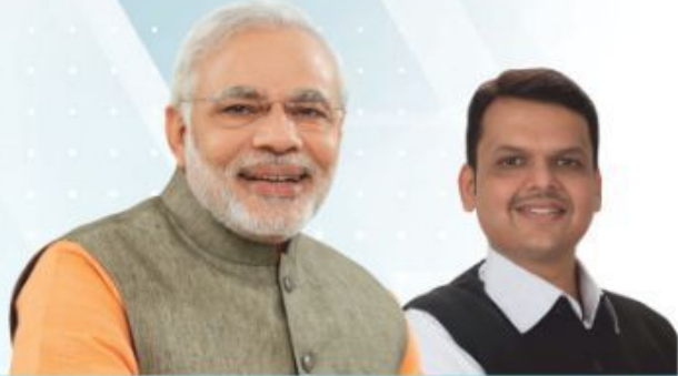
नरेंद्र मोदी प्रधान मंत्री